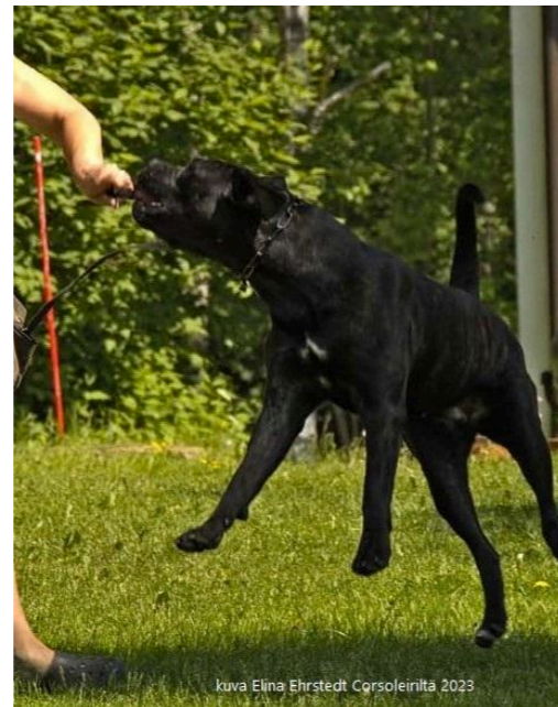
kuva Elina Ehrstedt Corsoleirilta 2023